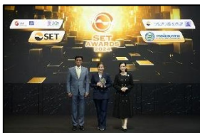
Outstanding Investor Relations Awards จากเวที SET Awards 2024