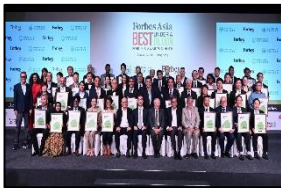
Forbes Asia Best Under A Billion 2024 จาก Forbes Asia