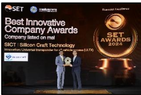
Best Innovative Company Awards จากเวที SET Awards 2024