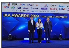
Best IR Awards จากสมาคมนักวิเคราะห์การลงทุน (IAA Awards 2024)